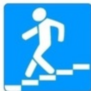
Знак 5.19.1. Подземный пешеходный переход