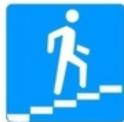
Знак 5.19.2. Надземный пешеходный переход

Если нет подземного или надземного пешеходного перехода, можно перейти по наземному пешеходному переходу