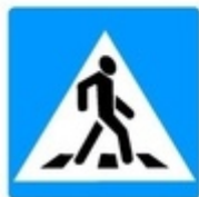
Знаки 5.19.1 и 5.19.2 Пешеходный переход