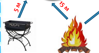
Место использования открытого огня